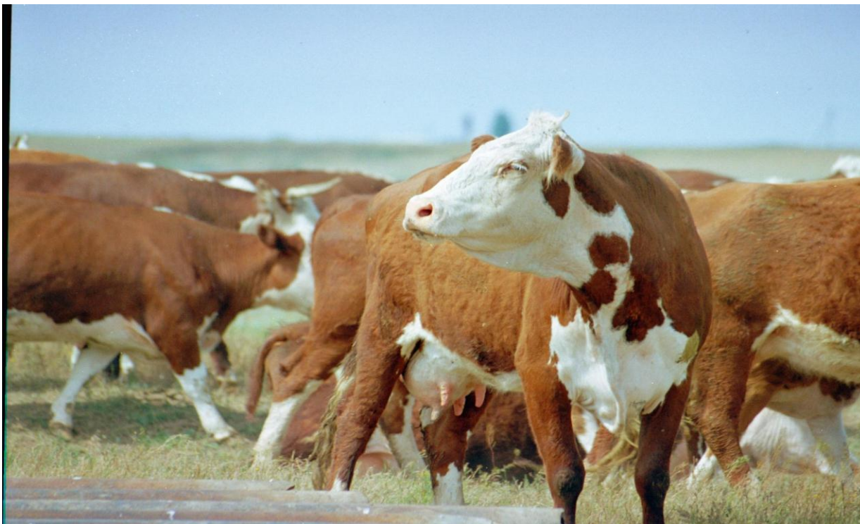
КРС СПК «Красный Октябрь»

Осенью 2010 года на ежегодной выставке в г. Москве «Золотая Осень» отличились СПК племзавод «Ромашковский» и СПК племзавод «Красный Октябрь», завоевав золотые медали.