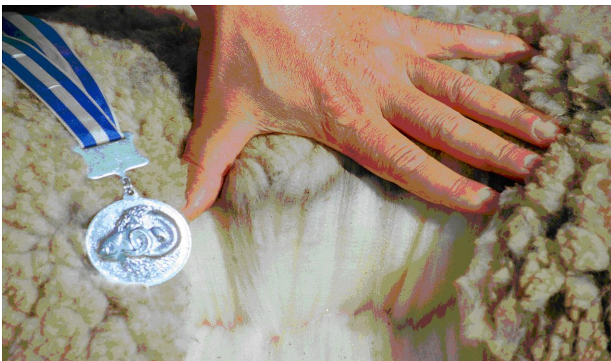
Тонкорунная порода овец

СПК племзавод «Палласовский» так же на выставке представлял мясошерстную породу овцы и был отмечен серебряной медалью.