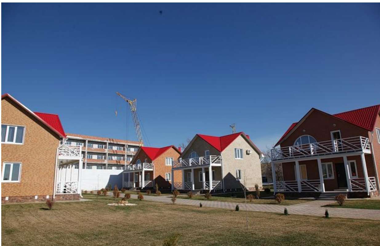
Санаторий «Эльтон-2» VIP-коттеджи

Окончание строительства планируется закончить в 3 квартале 2011 г., по плану санаторий создаст более 100 рабочих мест и даст возможность пройти курс лечения более 11тыс. человек в год.