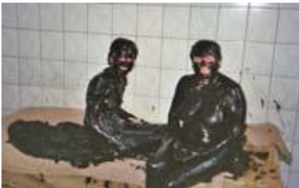
Лечение Эльтонской грязью

Рапа – хлоридная , натриево-магниевая, минерализация 284 г/л . Посоставу Эльтонская грязь во многом сходна с Сакской, Мертвого моря, которые, как известно, относятся к разряду лучших пелоидов, но по отдельным параметрам даже превосходят их.